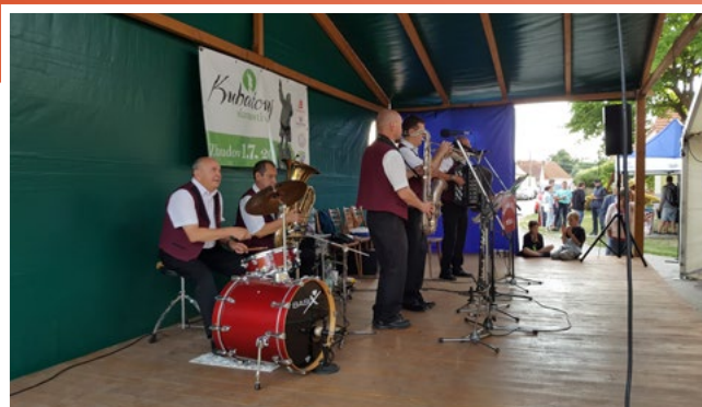
U pomníku Jakuba Kubaty